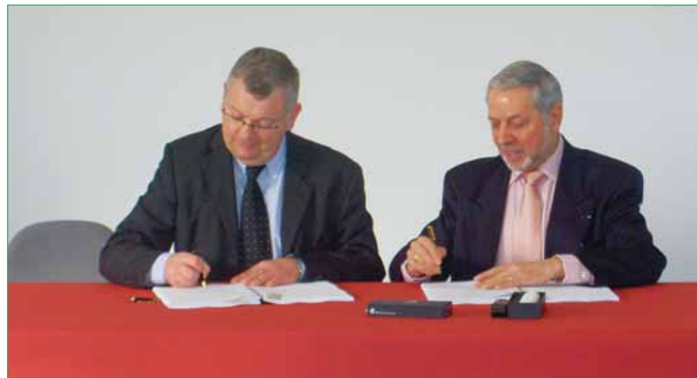
Signature de la délégation de service public pour l'exploitation de l'unité d'incinération des ordures ménagères de Saint-Thibault-des-Vignes