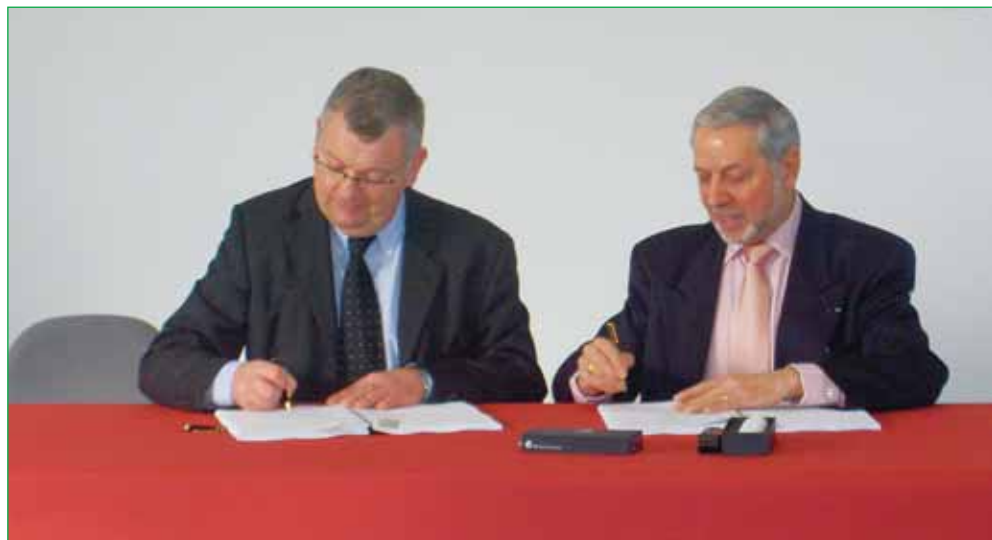
Signature de la délégation de service public pour l'exploitation de l'unité d'incinération des ordures ménagères de Saint-Thibault-des-Vignes