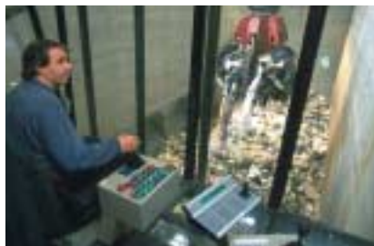
Actuellement, l'usine de Saint-Thibault-des-Vignes produit 2 mégawatts par heure et bientôt 10 mégawatts.

énergie, en cendres (3%), en nouveaux résidus (3%) et en mâchefer (30%). Le mâchefer est la partie non combustible des ordures, un mélange de verre, céramique, métaux, terre, eau... Après traitement, 100% du