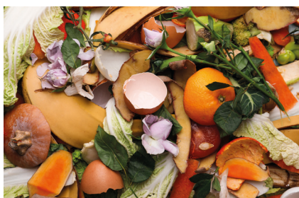
Expérimentation de la collecte des biodéchets