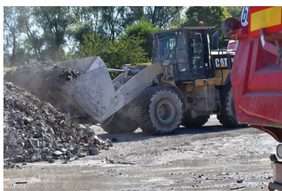
Un traitement des mâchefers plus vertueux