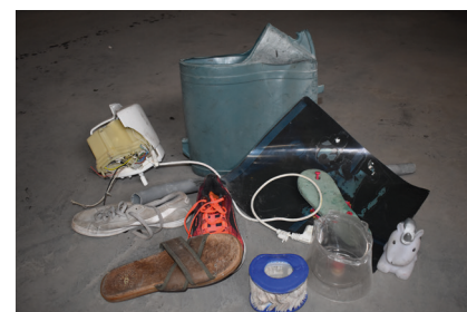
Des erreurs de tri bien trop nombreuses