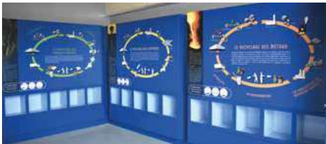
▶ Un parcours de visite ludo-pédagogique est en cours d'installation au sein du centre de tri

Un parcours de visite pédagogique a été imaginé pour que petits et grands puissent découvrir et comprendre le process de tri des emballages. Vidéos, jeux numériques, photographies, exposition... Un soin tout particulier a été porté à cet espace ludique. Quelques ajustements sont encore en cours de réalisation. Dès que l'accueil des publics sera possible, de plus amples informations vous seront communiquées.